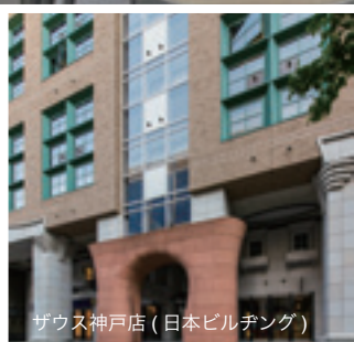
ザウス神戸店 ( 日本ビルヂング )