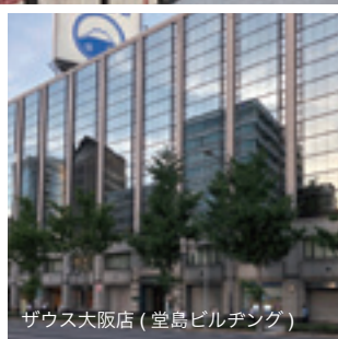
ザウス大阪店 ( 堂島ビルヂング )